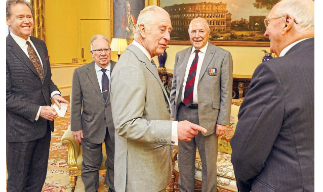
Rei Charles III conversa com veteranos da Guerra da Coreia

SÃO PAULO. O rei Charles III, 75, foi visto ontem deixando o Palácio de Buckingham, um dia depois de um comunicado falsamente atribuído à família real britânica circular em sites dizendo que o rei havia morrido. Embaixadas do Reino Unido na Rússia e na Ucrânia emitiram, então, um comunicado negando os boatos: "Notícias sobre a morte do rei Charles III são falsas", diziam.