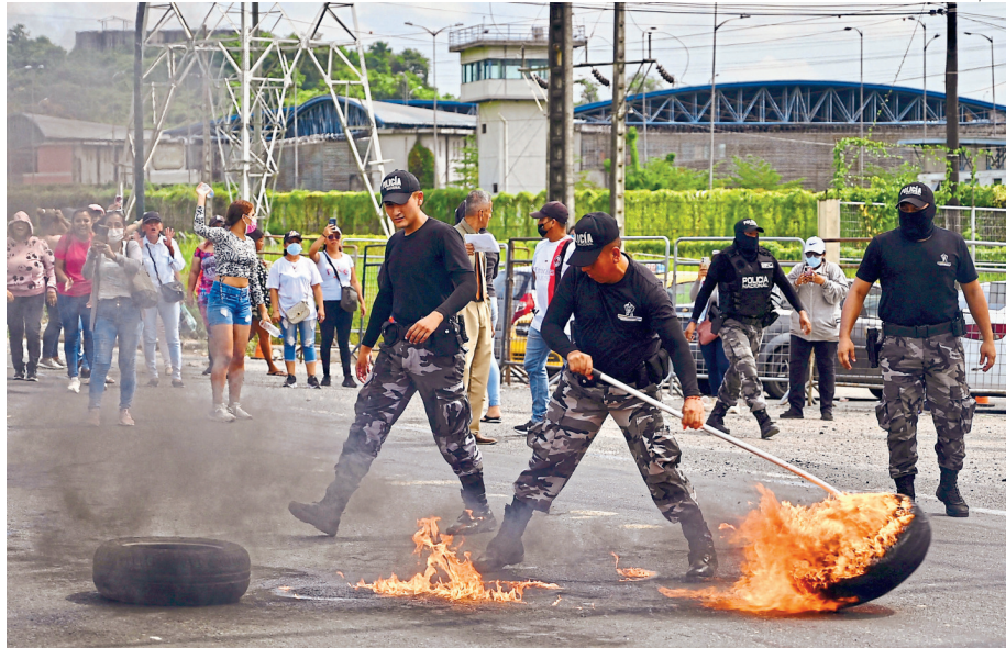
Rebelião. Na quinta-feira, penitenciária de Guayaquil, de onde o líder dos Choneros fugiu, enfrentou motim

Também no sábado, duas pessoas foram detidas pelo suposto envolvimento no caso dos cinco turistas sequestrados, interrogados e assassinados em uma